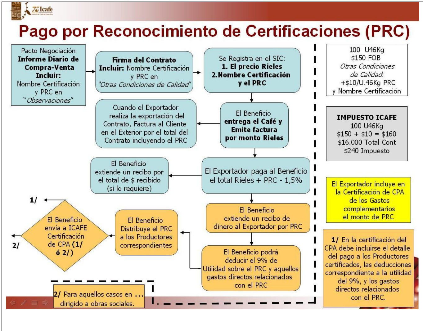
Diagrama de Flujo de Procedimiento “Pago por Reconocimiento de Certificaciones” (PRC).